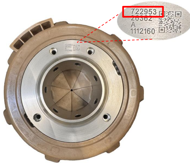
图 1 - IGV 喉管零件号位置